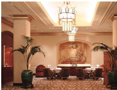
ホテルレセプション ※写真はイメージです。